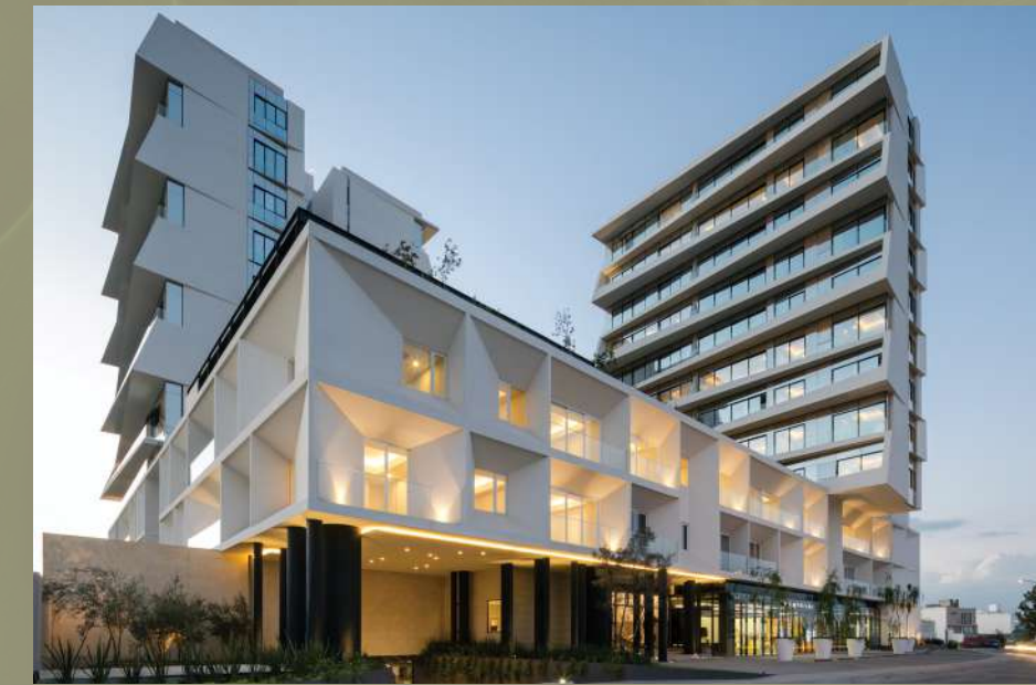
Torres La Toscana Zona Metropolitana de Guadalajara, Jalisco