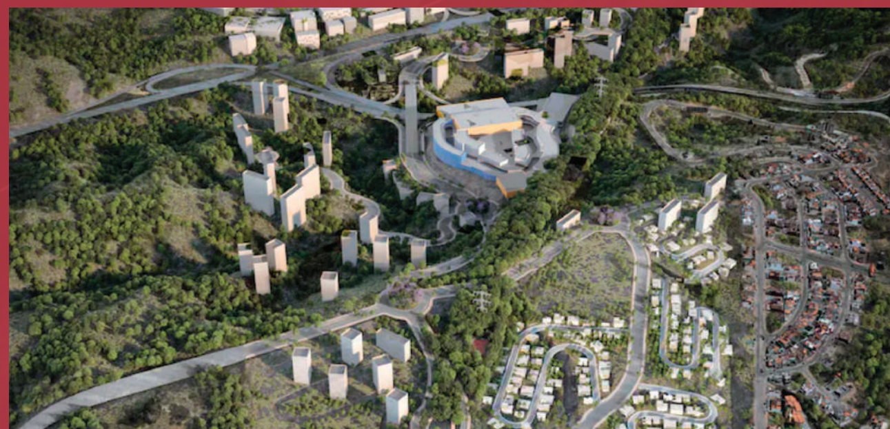
Plan Maestro LATIZ Estado de México, México

La propuesta arquitectónica de KULKANA destaca por la colaboración con despachos de arquitectura de renombre internacional.