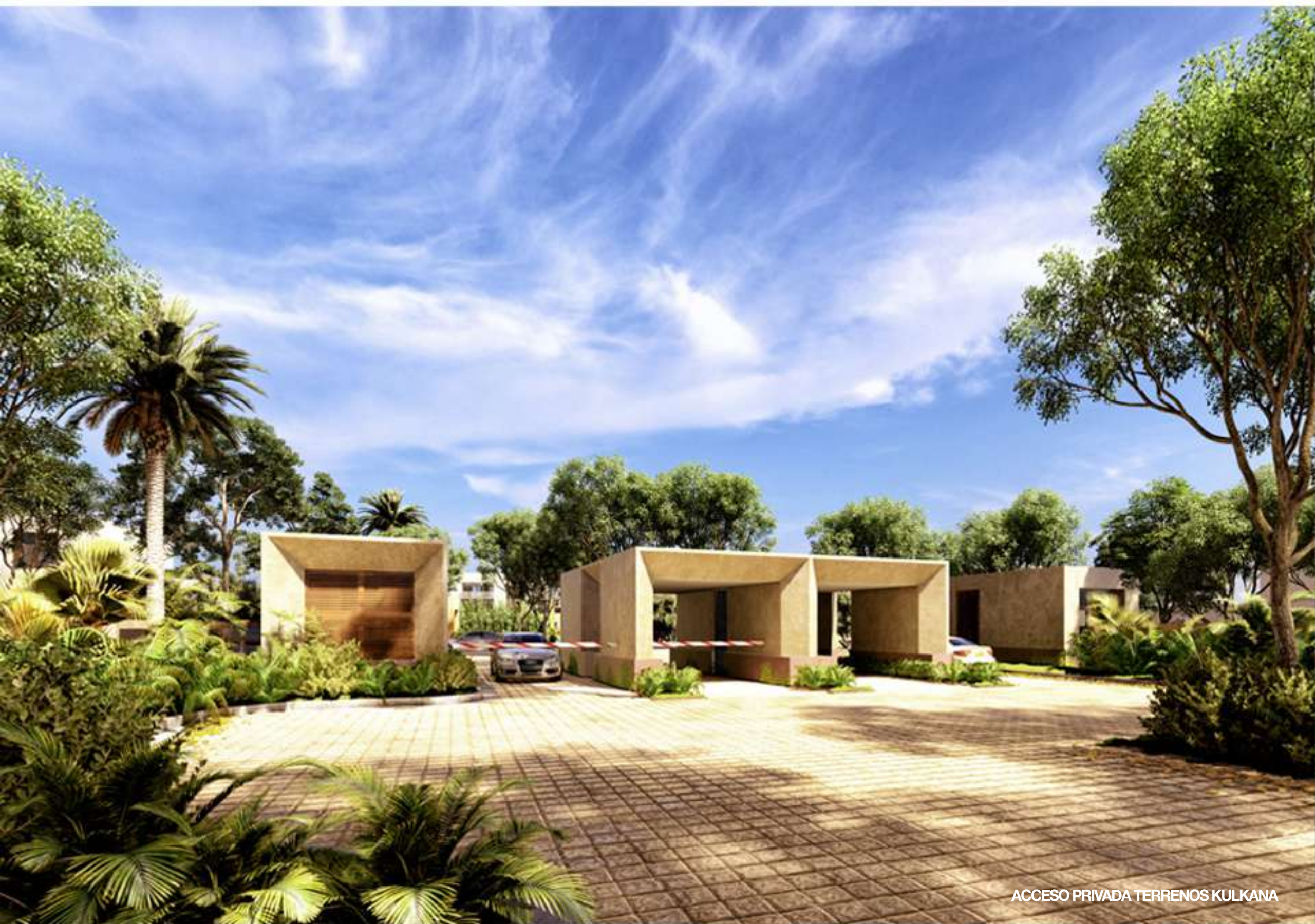
ACCESO PRIVADA TERRENOS KULKANA