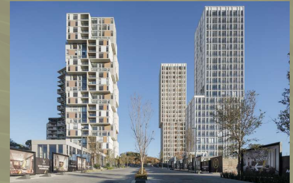
Ventura Zona Metropolitana de Guadalajara, Jalisco