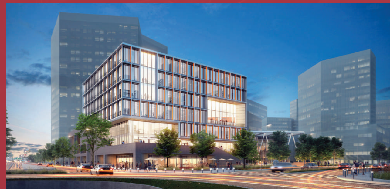
Tecnológico de Monterrey Monterrey, Nuevo León