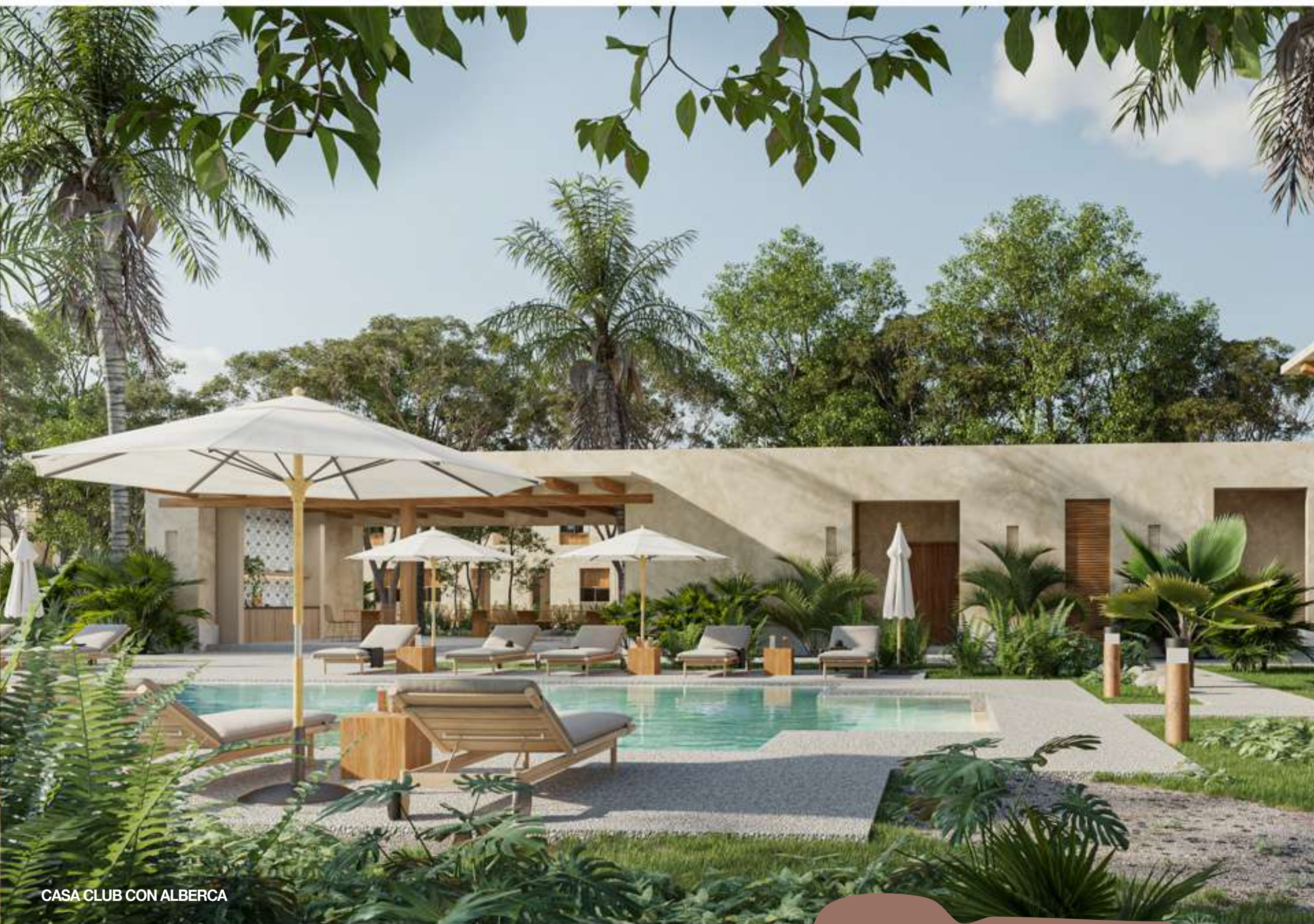
CASA CLUB CON ALBERCA