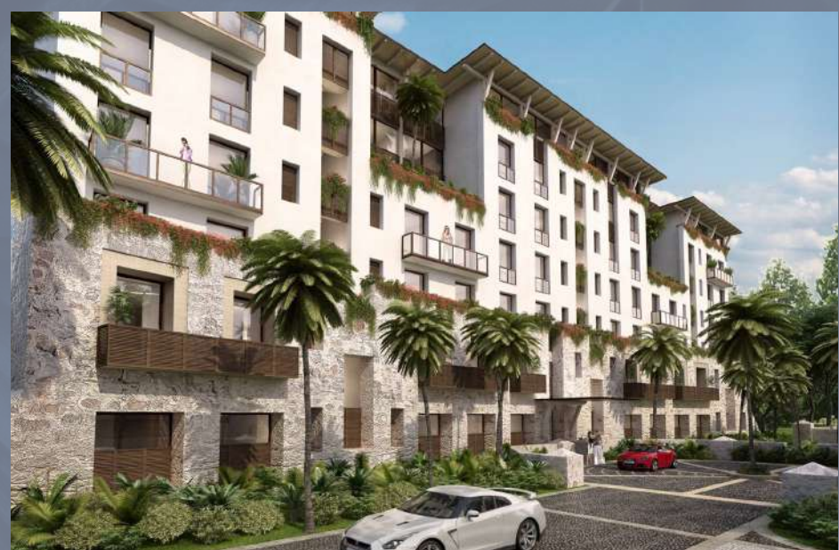
Kaánali Cancún, Quintana Roo