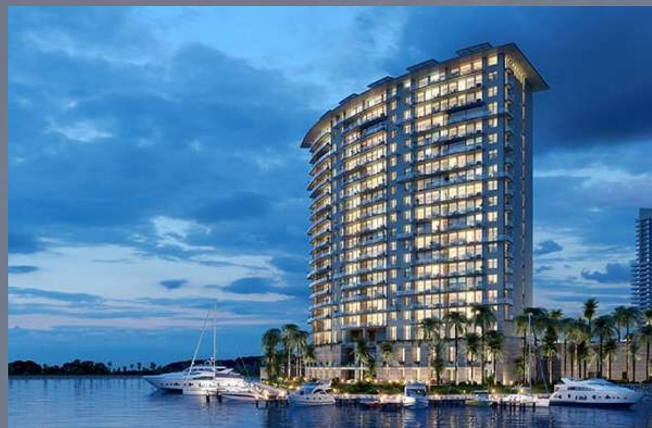
Aria, Puerto Cancún Cancún, Quintana Roo