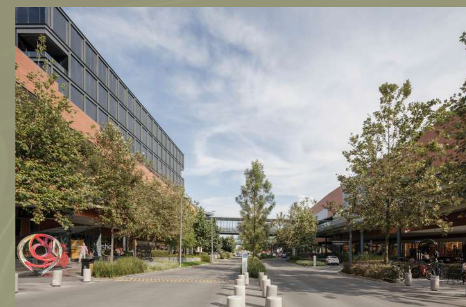
Punto Sur Lifestyle Boulevard Zona Metropolitana de Guadalajara, Jalisco