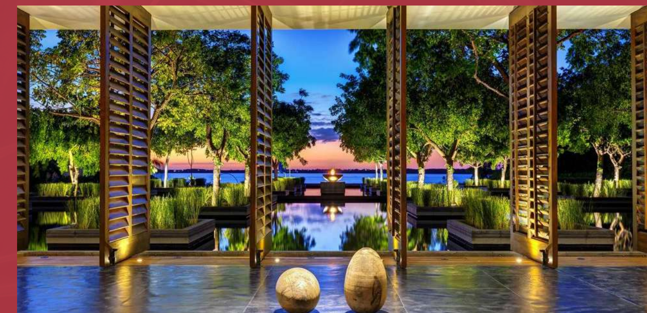
Brisas, Nizuc, Resort & Spa Cancún, Quintana Roo