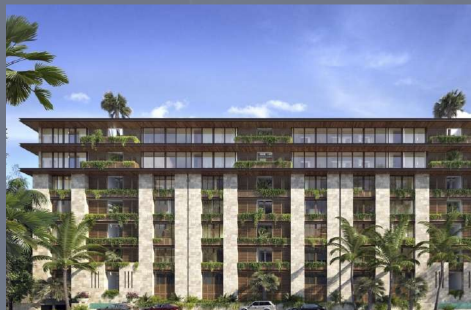
Punta del Mar Cancún, Quintana Roo