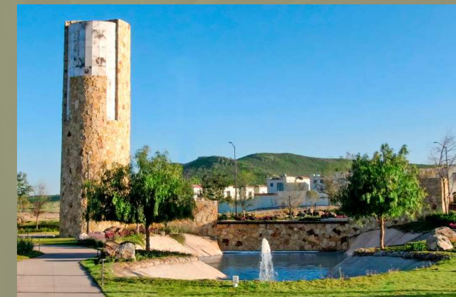
Capital Sur El Marqués, Querétaro