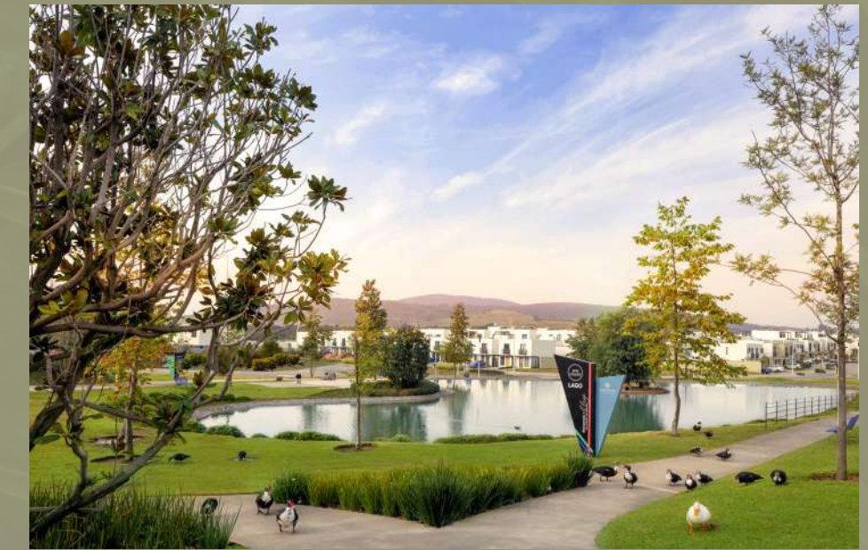
Adamar Zona Metropolitana de Guadalajara, Jalisco