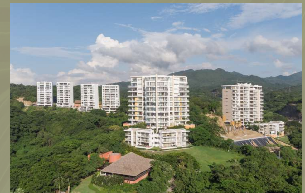
Alamar La Cruz de Huanacastle, Riviera Nayarit