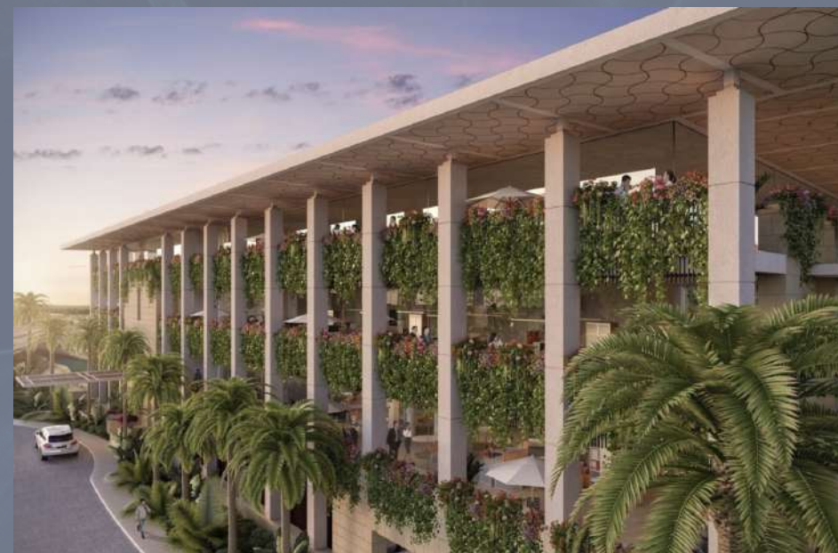
Port Marina Cancún, Quintana Roo