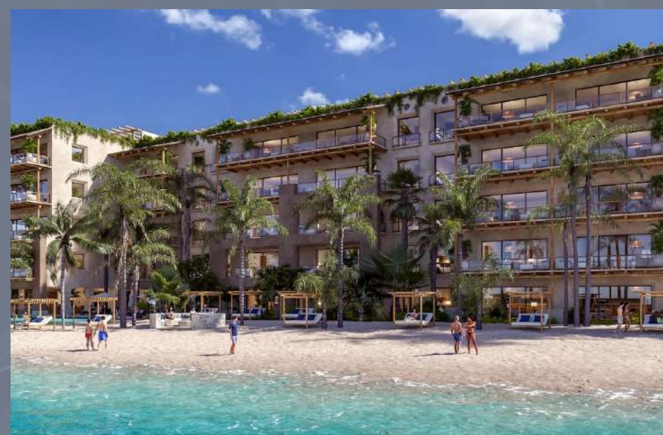
Artila Isla Mujeres, Quintana Roo