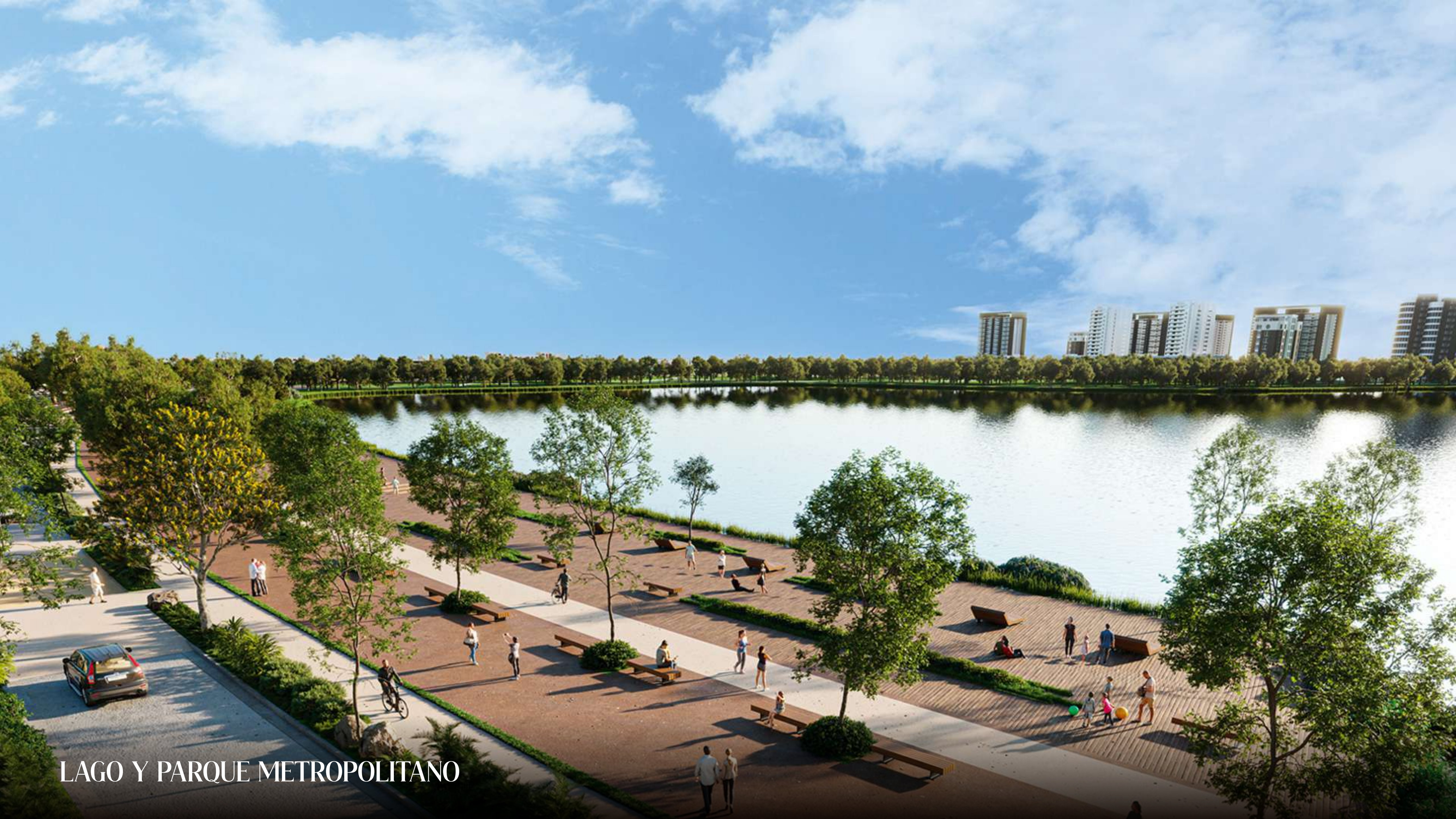
LAGO Y PARQUE METROPOLITANO