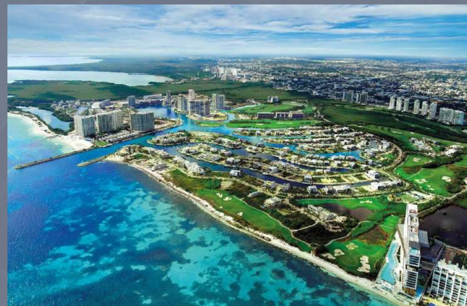
Fracc. Puerto Cancún Cancún, Quintana Roo